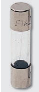
Foto del prodotto / Product image